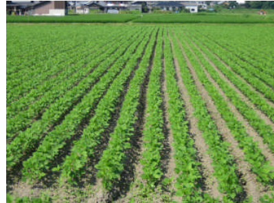
<溝上げ播種後の良好な生育状況>