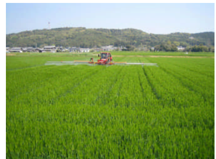
<ブームスプレーによる実肥同時防除>

今までは、2回の赤カビ病防除とは別に実肥を施用していたが、新技術導入により、実肥施用を赤カビ病防除と同時に行ったため、労力が低減され、コスト低下に結びつくとともに適期作業が可能となった。特に大規模経営での導入に効果的である。